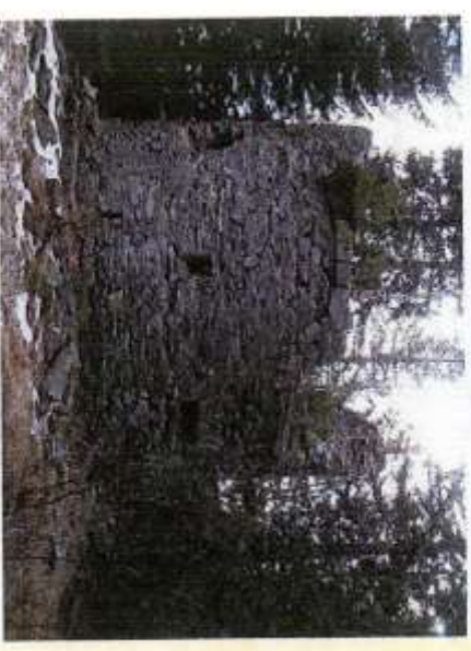
Le Poste Optique aujourd'hui