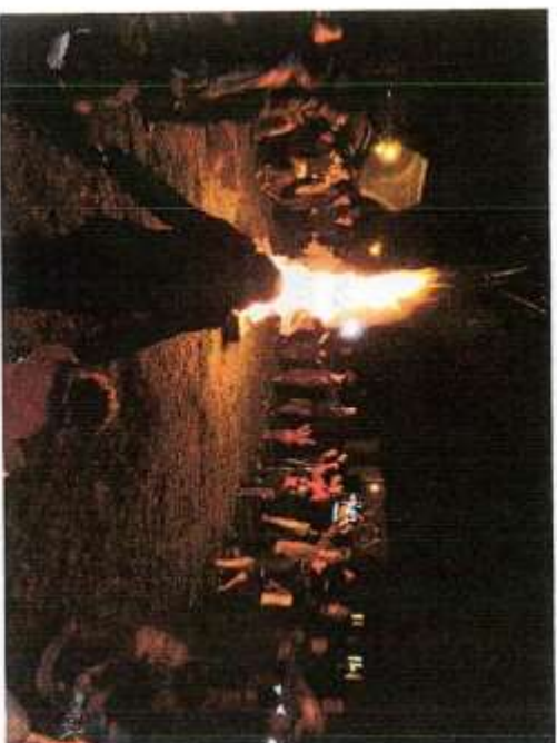
Les failles 2017

Partageons-le avec nos enfants, dans une belle farandole pour brûler l'hiver, par exemple :